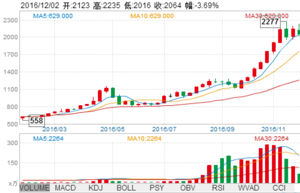
大连商品交易所焦炭期货本周行情